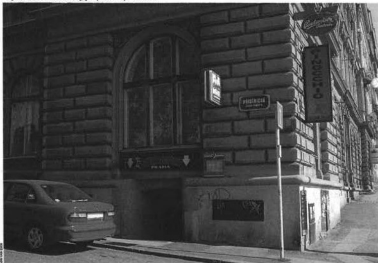
Jongensbordeel Pinocchio te Praag, geen plek voor topambtenaren.