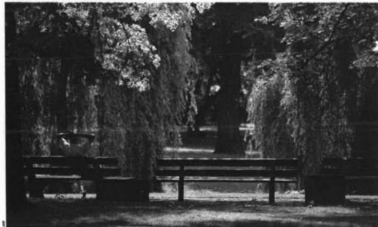
Het is de laatste maanden opvlendend rustig in het Anne Frankplantsoen...

Toch worden er korte tijd later drie mannen uit Weert en omgeving gearresteerd. Allereerst is dat Cor K., de directeur van een bedrijf met 150 man personeel, die daarnaast voor een paar tientjes bij de politie mannen verlinkt die zich schuldig maken aan verboden contacten. En dat tervrij Cor ze zichzelf wel toestaat. Uitgerendeking hij staat bekeerd als iemand met interesse voor wel heel erg jong. Zowel binnen zijn bedrijf als in het park ▶