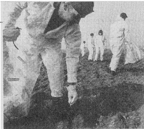
Militairen ruimen de rommel op.

De voeding van \pm 120 man op het explosie terrein kwam traag op gang. Er was onduidelijkheid over wanneer er voeding kwam en waar. Het zou in een dergelijk geval prettig zijn als er op het terrein een centrale persoon zou zijn die exact op de hoogte is welke personen of groepen zijn voorzien en welke niet. De 'broodkar' nam nu steeds dezelfde route en was na een kwartier leegverkocht. Hierdoor moesten groepen achter op het terrein uren wachten. De inzet van de diverse eenheden is goed verlopen. Spilfuncties zijn er voor de VC en blusvoertuigen. Hulpverleningsvoertuigen zijn een efficiënt middel voor afzettingmateriaal, explosie veilige handlampen en het verstrekken van vuilniszakken voor het verzamelen van los vuur-